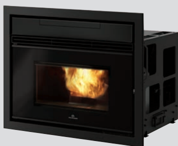
Kit tiroir de chargement frontal