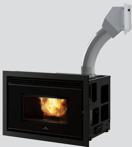
Kit de chargement par trappe